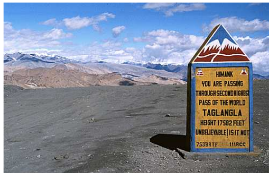
Nubra Valley ed il passo Taglangla

L'AVVENTURA IN MOUNTAIN BIKE Terminata l'avventura alpinistica, inizio il mio viaggio in bici apprestandomi ad abbandonare la Nubra Valley, un tempo situata sulla rotta commerciale tra il Tibet e il Turkestan, non prima di aver valicato il passo carrozzabile più alto al mondo, il Kardung La (5602 mt). Mi aspetta una discesa di 40 chilometri, dove metterò a dura prova i freni e la forcella ammortizzata della mia mountain bike Carraro. Arrivato a Leh, capitale del Ladakh, mi fermerò un paio di giorni, per assistere al più grande festival culturale religioso di questa straordinaria regione.